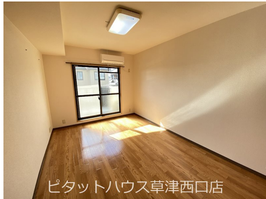
ピタットハウス草津西口店