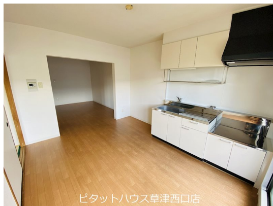
ピタットハウス草津西口店