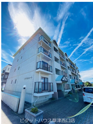
ピタットハウス草津西口店